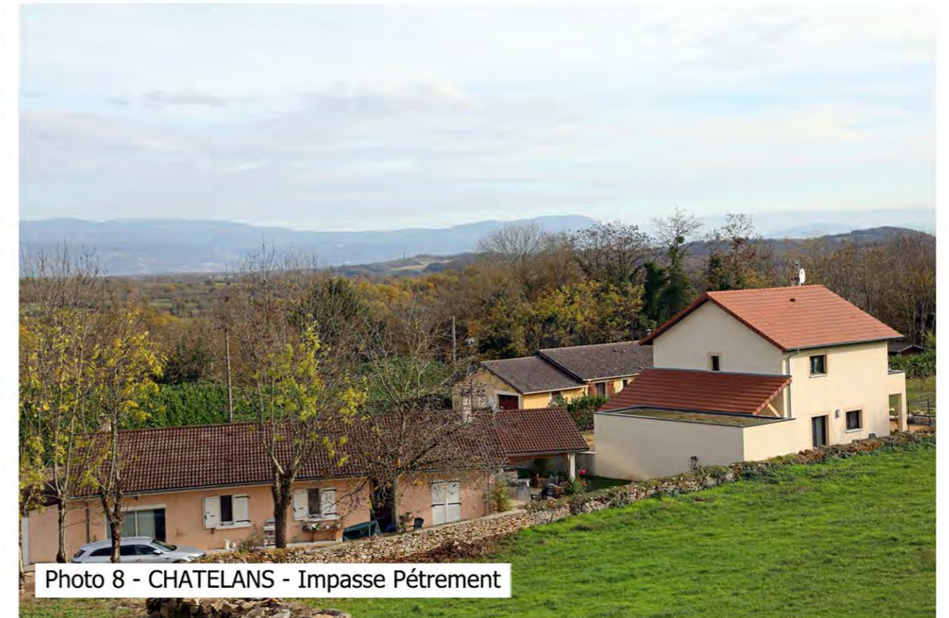
Photo 8 - CHATELANS - Impasse Pétrement

Nota : Les photographies prises avec un objectif de 50 mm correspondent à la restitution de la vision humaine.