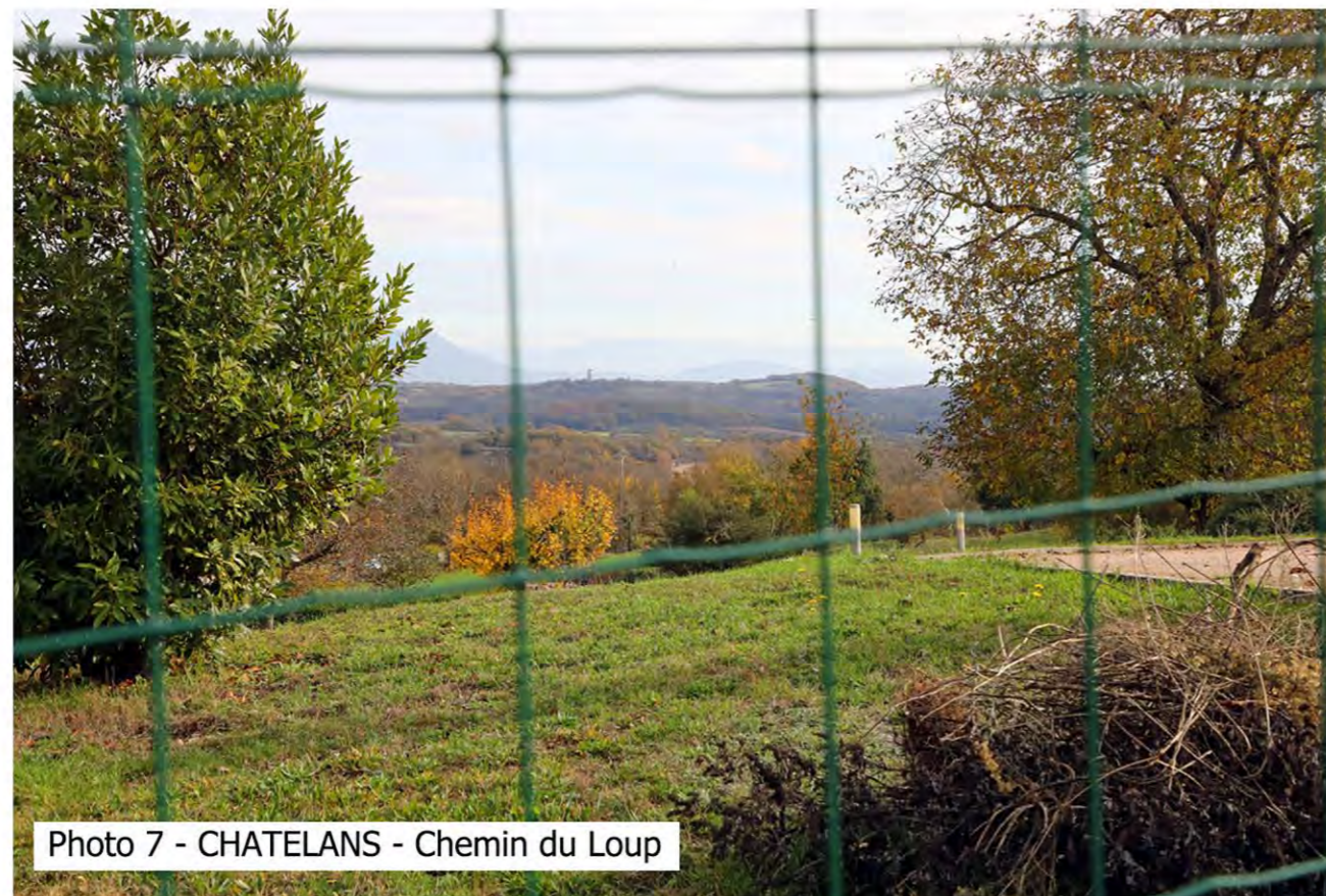
Photo 7 - CHATELANS - Chemin du Loup

Il est toutefois possible que, depuis les terrasses de certaines habitations tournées vers la carrière en haut du Chemin du Loup, cette perception soit proche de celle relevée sur la photo 6.